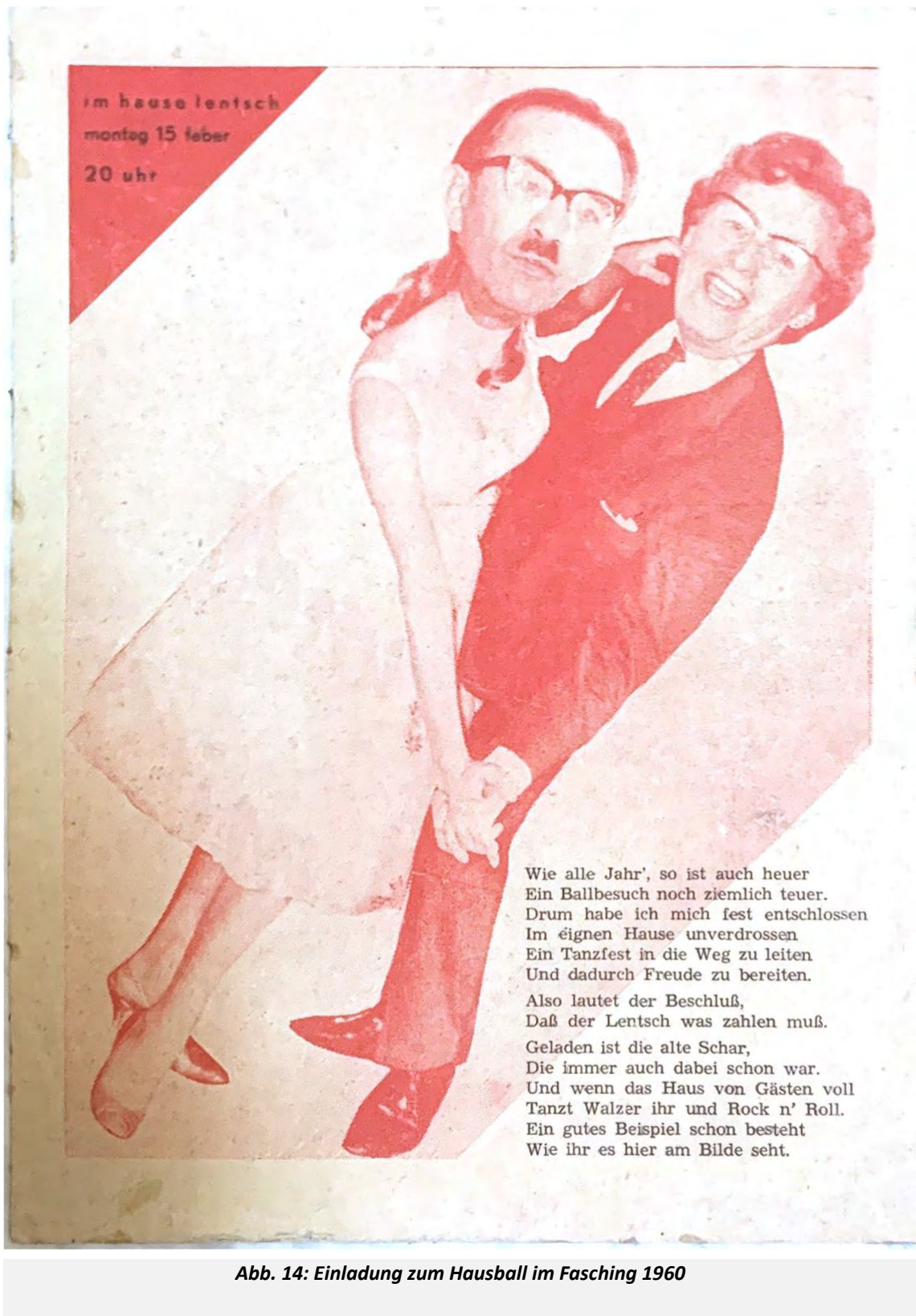
Abb. 14: Einladung zum Hausball im Fasching 1960