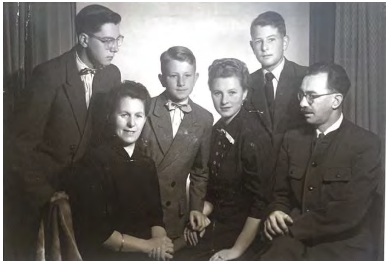
Abb. 6: Familienfoto aus den 1950ern

Auch privat kam es im Hause Lentsch zu Veränderungen. Im gemieteten Haus in Kleinhöflein war es eng geworden, auch weil Lentsch oft Parteikollegen mitbrachte. 96 In der Wiener Straße in Kleinhöflein erwarb der Familienvater ein Grundstück und begann darauf ein Haus zu bauen, 97 was sich als schwieriges Unterfangen herausstellte,