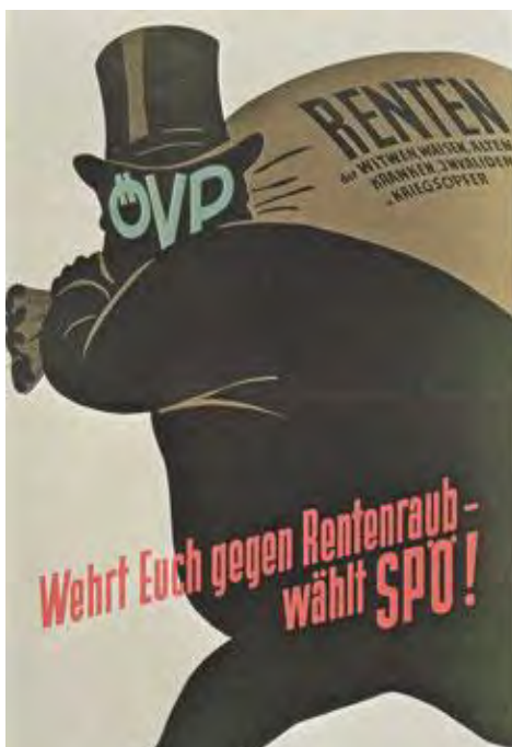
Abb. 7: Wahlplakat der SPÖ 1953

Nach dem Aufwärtstrend nach Kriegsende erreichte Anfang der Fünfziger Jahre die Arbeitslosigkeit im Burgenland ihren Höhepunkt. Die Bundesregierung versuchte deshalb die Preisentwicklung zu beeinflussen und setzte auf eine deflationistische Wirtschaftspolitik. Dieser Versuch, die wirtschaftliche Situation zu entschärfen, ging jedoch nach hinten los. Die Folgen waren Arbeitslosigkeit und Minderung der Produktionstätigkeiten im Burgenland. Ganze 8.607 Arbeitslose gab es 1953, das bedeutete einen Höchststand seit den Dreißigerjahren. 98 Diesen Umstand konnte die SPÖ Burgenland im Wahlkampf für sich nutzen. Wahlplakate der SPÖ zeigten die ÖVP als einen schwarzgekleideten, wohlgenährten Mann mit „Kapitalistenzyylinder“ und einem Sack in der Hand, auf dem sich die Aufschrift „Renten“ befand. 99